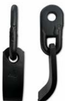
VD 165 J

Rechts: \pm 5,70 m Reichweite, links: \pm 4,70 m Reichweite mit VD 1250 HD. Perfekt ausbalanciert von der Fahrzeugmitte bis zur Außenseite des Schneidkopfes. Die Absaugung erfolgt im Schneckenbehälter hinter dem Rotor. Dieser ist mit einer Schnecke ausgestattet, die das Schnittgut zentriert, sodass nicht direkt vom Boden abgesaugt wird.