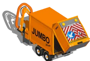
JUMBO MASTER 35 M 3