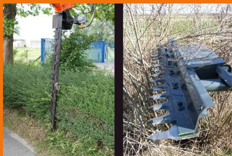
Vielseitigkeit : Anbau Heckenschere oder Astschere ist möglich