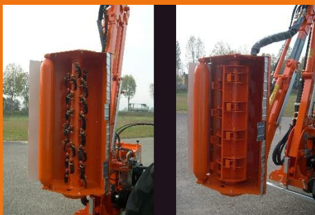
Wahl : Mähkopf mit Schlegeln oder Käfig Rotor mit Hammern