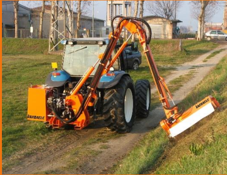
Standardmäßig Heckanbau Optional : vorne angebaut