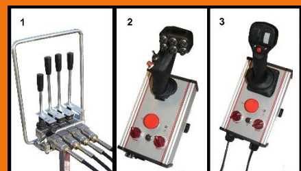
Standard mit teleflex Kabeln, optionsmäßig mit Drucktasten oder mit Joystick