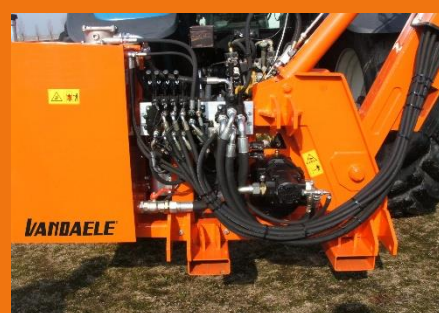
Mit eigener Ölversorgung : Ölbehälter, Zwillingspumpe und Verteiler